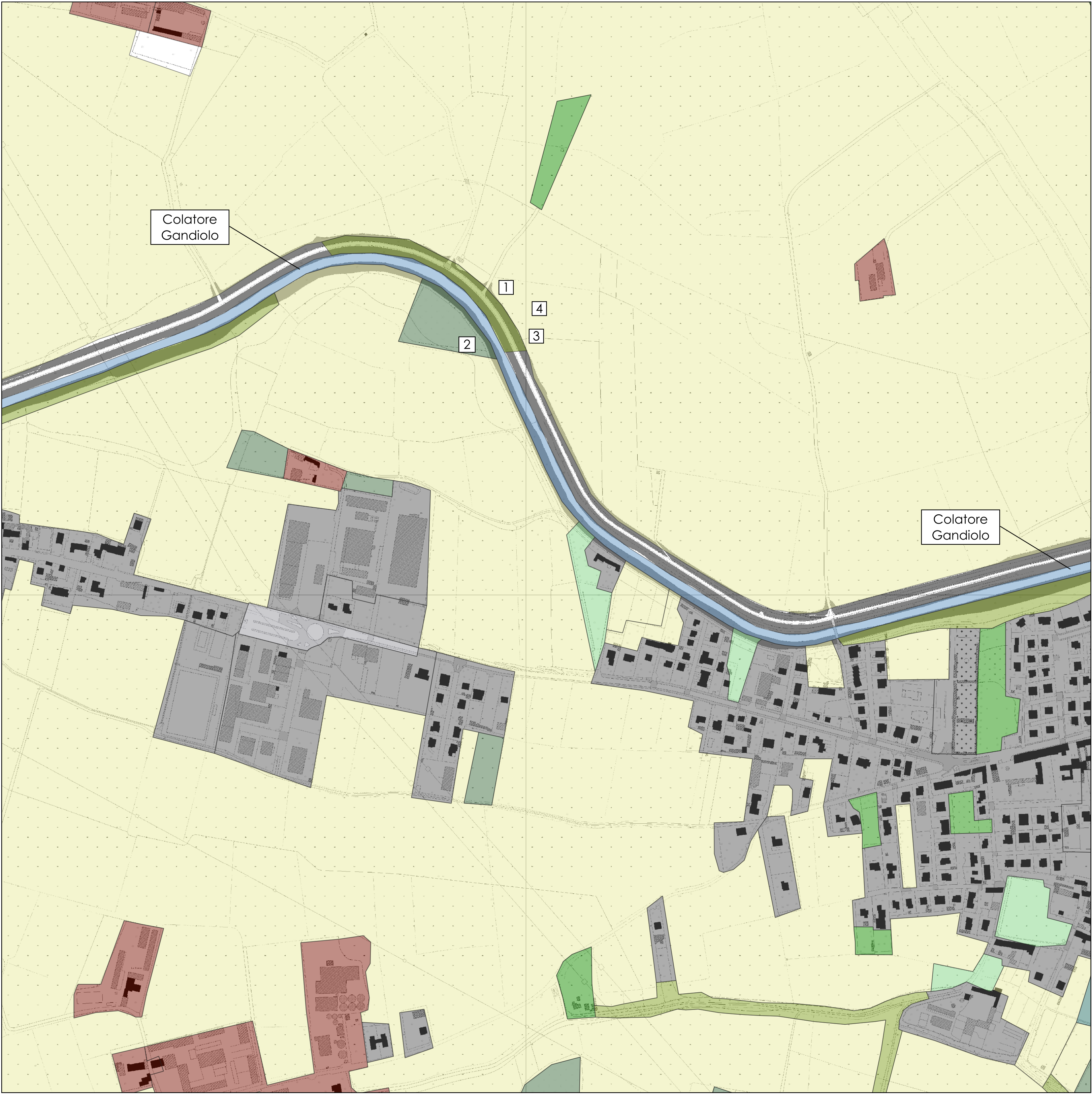
Planimetria dell'area oggetto dell'intervento con indicazione dell'uso del suolo scala 1:4.000